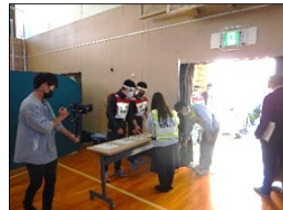
開設訓練の様子